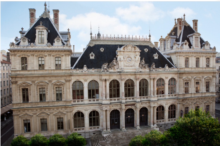
Palais de la Bourse

La soirée de gala, avec les traditionnelles remises de prix, aura lieu dans la salle de la Corbeille, où, jusqu'au milieu des années 1980s, opéra la Bourse de Lyon.