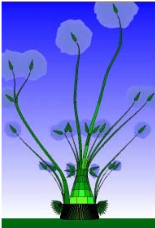
Représentation sous forme d'arbre

pour dire que chaque document est indexé par peu de propositions et que la grammaire permet de discerner de nombreux fragments différents (beaucoup de branches fines et un tronc bas). Une autre représentation autorisée par l'outil, sous forme cette fois d'archipel, permet d'aller plus loin dans l'analyse et de remarquer notamment certains groupements caractéristiques. La zone centrale de l'archipel représente les propositions qui dominent. Les petites îles périphériques permettent de découvrir des rapprochements entre des fragments de SDAR de régions différentes, sur des thèmes plus rares. Nous avons souligné dans la carte les engagements qui caractérisent les propositions de certaines îles qui représentent des regroupements dus à des similitudes entre documents. Cela confirme la possibilité pour l'analyste de ce type de cartographie d'envisager des hypothèses de synergies interrégionales à partir de ce type de cartographie.